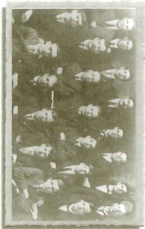
Y Clwb Ymholiadau

Cerddwch i fyny'r ffordd i'r Cylch. (2) Yn union ar eich chwth, mae Clwb Cymdeithasol Tredegar: o falconir adaeliad yma y cyhoeddwyd y cyfrif Seneddol ar un cyfnod. Edrychwch i'r dde, ar y cornel gyferbyn â'r Llyfrgell mae'r adaeliad a oedd yn gartref i'r Gymdeithas Gymorth Feddygol. Dyma ragflaenydd y Gwasaneth Iechyd Cenedlaethol. Cychwynwyd y gymdeithas yn 1890 gan Iöwyr lleol a gweithwyr dur a glybiodd gyda'i gilydd er mwyn cyflogi meddyg. Ymhén amser ymunodd y rhan fwyaf o bobl y dref a bu yn bosibl cyflogi pum neu chwech meddyg. Yn anochel, roedd gan Cwmni Glo a Haearn Tredegar ei dewis ddynion mewn safleoedd pŵerus o fewn y Gymdeithas a dyma oedd un o'r sefyllfaoedd a ddymunai'r Query Club eu gwella.