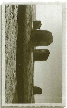
Meini Coffa Aneurin Bevan

maen canol yn cynrychioli Aneurin Bevan ar lleill yn cyfeirio at Glyn Ebuw. Rhyddiadau Tredegar (y tair cymuned yn ei etholaeth) Mae hanes byr o'i fywyd yn y Panel Gwybodaeth a llun ohono yn siarad ar y safle. (Mae'r cerrig hefyd yn safle cychwyn ffordd Cerdded Cwm Sirhywi)