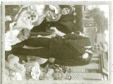
Diwrnod Carnifal yn Mredegar

Cerddwch ymlaen trwy Teras Harcourt, gan gymryd y trydydd droed ar eich chwth (tua 300 llath) ac yna'r cynnat ar y dde. Yng nghymedd Canolfan Meddygol Aneurin Bevan (4) fe welwch lun o Nye gan y