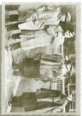
Bevan yn Llundain yn aros am Gorymdeithwyr Jarrow

yn 31 oed. Yn San Steffan, cyfarfu â Gwleidydd Sosialaidd arall - Jennie Lee, a phriodwyd hwy yn ddiweddarach. Gweithredodd fel golygydd y papur newydd adain chwth "Tribune" o 1942-45. Etholwyd ef ar Bwyllgor Gwaith Cenedlaethol y Blaid Lafur yn 1944 a daeth yn Weindog Iechyd yn 1945. Chwaraeodd y rhan arweiniol mewn sefydlu'r Gwasanaeth Iechyd Cenedlaethol gan osod ar waith y rhaglen tai i'r cyhoedd fwyaf a lanswyd erioed ym Mhrydain. Daeth ef i fod y llefarydd mwyaf gwreiddiol ar sosialaeth ddemocratiaid trwy'r byd.