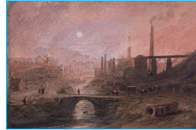
Gwaith Haearn Nant-y-glo, 1829

Gadewch y maes parcio trwy'r ffordd gul i mewn i Sgwâr y Farchnad. Yn y sgwâr roedd Tramffordd Llangatwg yn rhannu'n ddau. Roedd y gangen chwith yn rhedeg bron ar onglau sgwâr i lawr Station Road tuag at 'Limestone Road' a'r gwaith haearn.