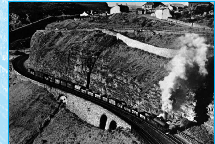
Rheilffordd yr MT & A

Ar ôl rhyw 300m, fe welwch arhosfa ar ochr arall yr A465. Yma fe welwch Lefelau Glo Clydach a agorwyd yn 1812 i gyflenwi glo i'w werthu yn Y Fenni. Mae un fynedfa'n debyg i geg ogof yn ochr y ceunant; mae gan y llall fwa o gerrig cain a adeiladwyd adeg gosod Rheilffordd Merthyr, Tredegar a'r Fenni.