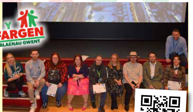
Gallwch weld 'Ein Blaenau Gwent' drwy sganio'r Cod QR.