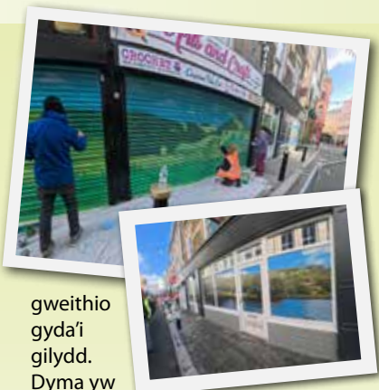
gweithio gyda'i gilydd. Dyma yw Y Fargen!

Dangosodd y trawsnewidiad fis Mawrth yr hyn sy'n bosibl gyda chydweithio, creadigrwydd ac ychydig iawn o arian. Galwodd hyn am gefnogaeth wirioneddol gan y gymuned – diolch i bawb a ddaeth ac a helpodd i ddangos beth y gellir ei gyflawni pan fo pawb yn