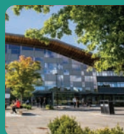
Parth Dysgu Blaenau Gwent