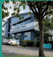
Campws Dinas Casnewydd