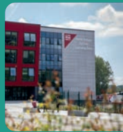
Parth Dysgu Torfaen